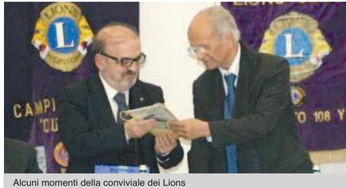
Alcuni momenti della conviviale dei Lions