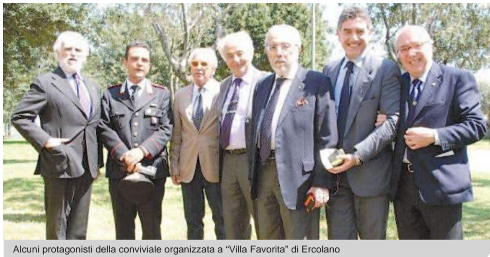
Alcuni protagonisti della conviviale organizzata a "Villa Favorita" di Ercolano

Lo splendido Parco sul mare di "Villa Favorita" ha fatto da degna cornice ad un convegno dal titolo Giustizia e società civile che ha visto relatori di prestigio dibattere sullo scottante e ampio tema dei rapporti tra giustizia non solo quella penale, ma civile e amministrativa come specchio della società in un determinato momento storico. La graziosa casina dei mosaici in vetro e madreperla abilmente restaurata - anche questa dall'architetto Paolo Romanello, da sempre direttore dell'Ente Ville Vesuviane, ora Fondazione, ha accolto una fitta partecipazione di giuristi e rotariani, addetti ai lavori o semplici uditori. La giornata, che oltre ad un dejeuner sur l'herbe del parco, prevedeva anche un concerto e una cena, era organizza-