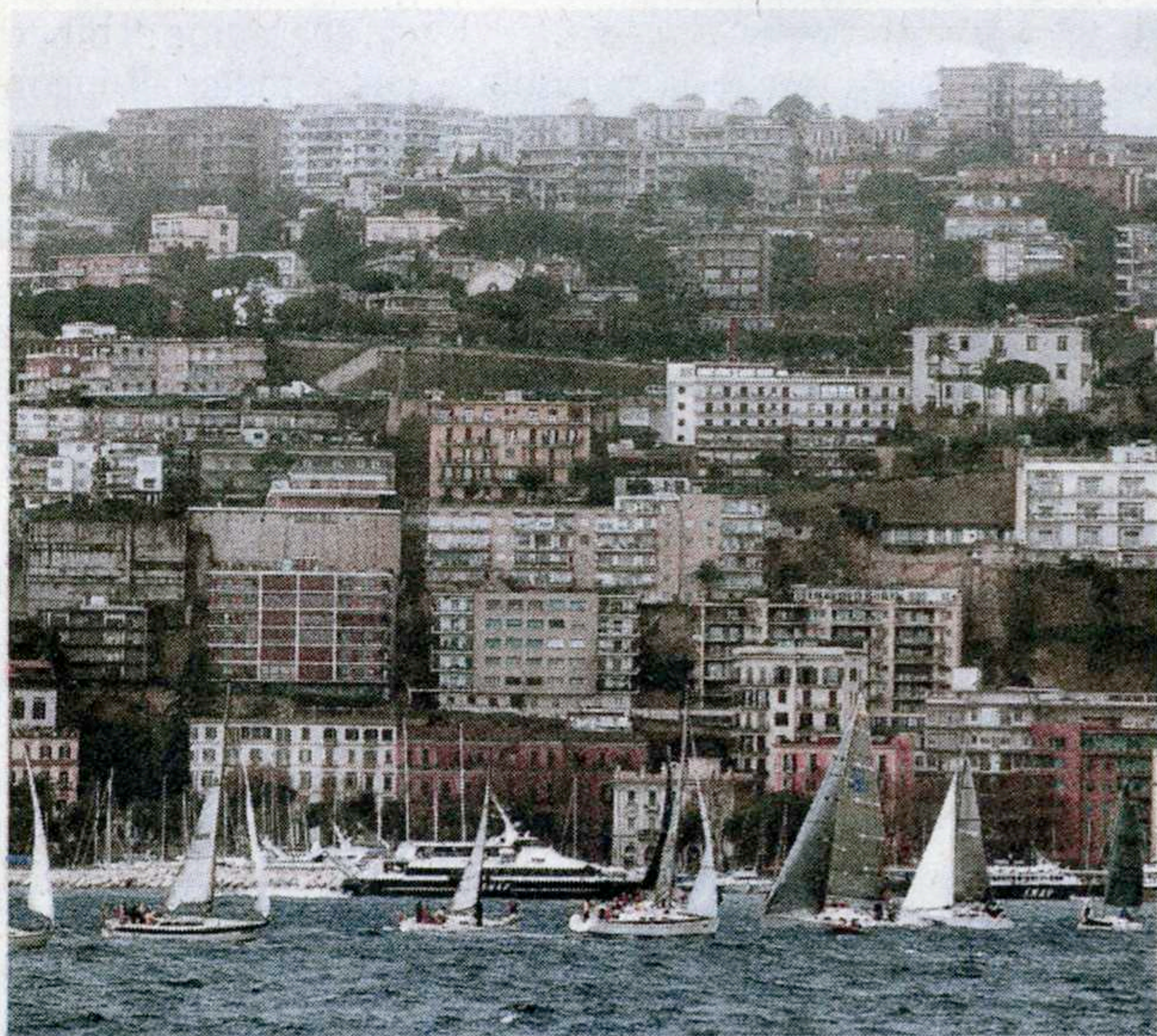
Il trofeo Via alla regata del Rotary Club nel golfo.